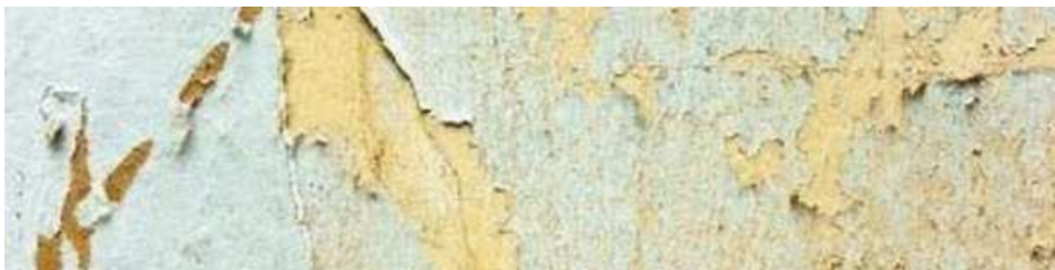
Paisajeras Estudio Diseño de interiores y decoración