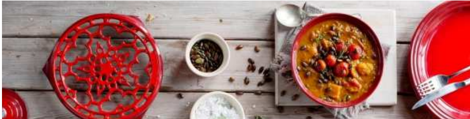
Cooking TKC Artículos y cursos de cocina